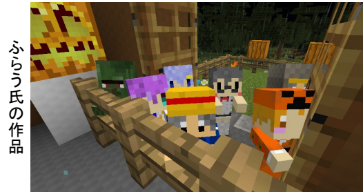
ふうりう氏の作品

運営チームは、この事態を憂慮し、募集期間の延長に踏み切った。募集期間ギリギリまでコンテストの宣伝と作品の募集を呼びかけていく予定だ。また、同チームからも何名かスタッフ が作品を投稿し、盛り上げにいく予定だ。どんな作品が投稿されるのか期待したい。